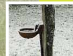
Eau de conduite