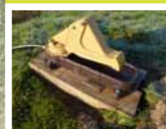
Pompe à museau