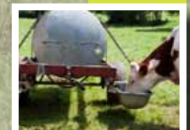
Tonne à eau